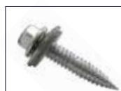
Vis Drillnox DBS2

La vis Drillnox DBS2 : cette vis autoforeuse possède des caractéristiques mécaniques adaptées à la fixation sur bac sec acier avec une résistance hors norme, une longueur d'implantation plus importante et un couple de foirage élevé même dans les petites épaisseurs (> 5 N.m contre une moyenne de 1.5 N.m). Nous préconisons l'utilisation du limiteur de couple DBS CONTROL qui est spécifiquement adapté à cette vis autoforeuse.