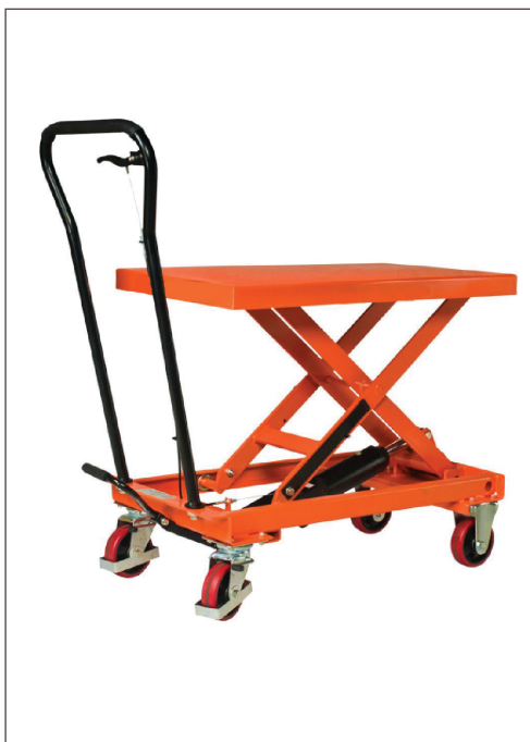
TABLE ÉLÉVATRICE MOBILE MANUELLE