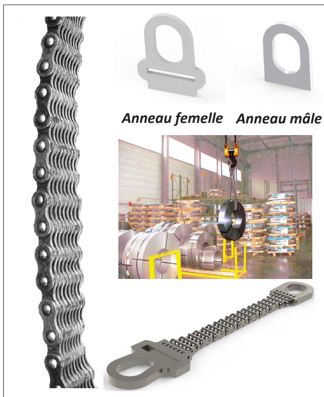
Anneau femelle Anneau mâle